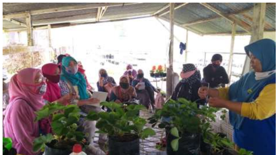
Gambar 5. Mendampingi Karyawisata Kelompok Tani Ke BBI Ngipiksari