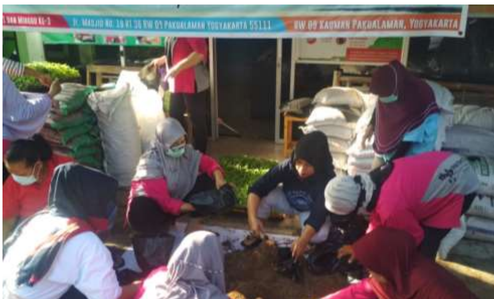
Gambar 9. Mengajar Kursus Tani / Bimbingan Teknis