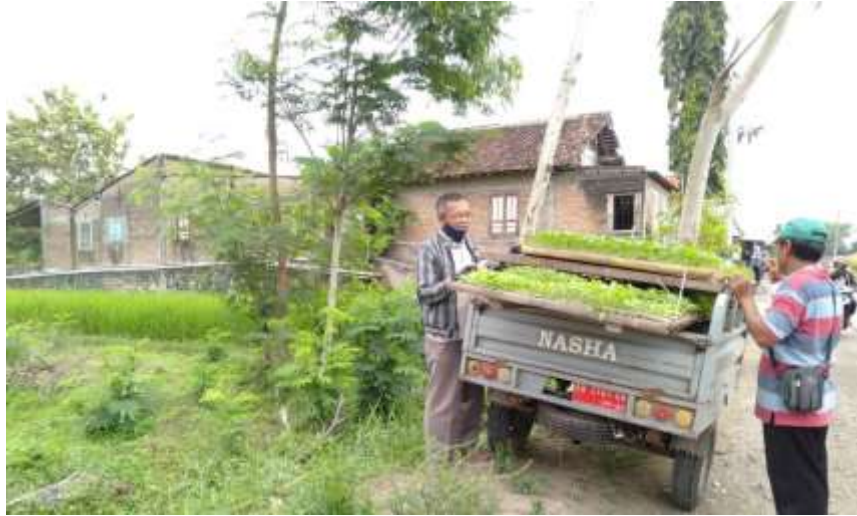
Gambar 20. Kerjasama Penyediaan Bibit Dengan Penyedia Bibit