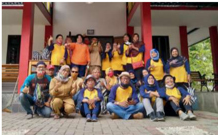
Gambar 3. Pelatihan Anggrek Poktan Sumber Rejeki di BPP Nitikan