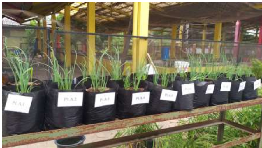
Gambar 23. Demplot Bawang Merah