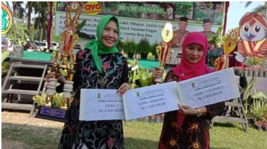
Gambar 16. Pembinaan Kelembagaan Melalui Berbagai Lomba