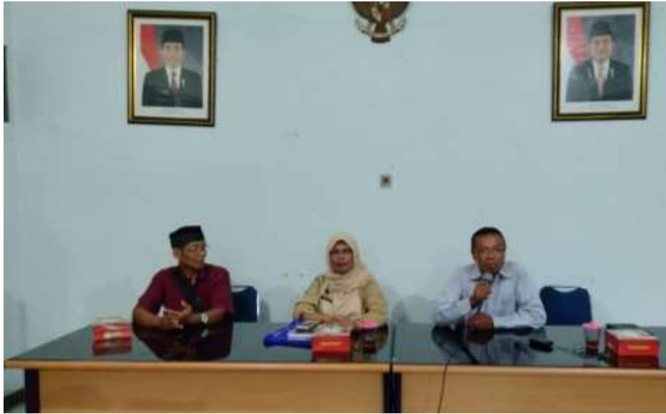
Gambar 10. Mengajar Kursus Tani / Bimbingan Teknis