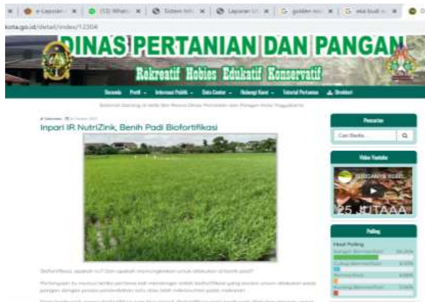
Gambar 14. Penyebaran Informasi Komoditas Tanaman Pangan