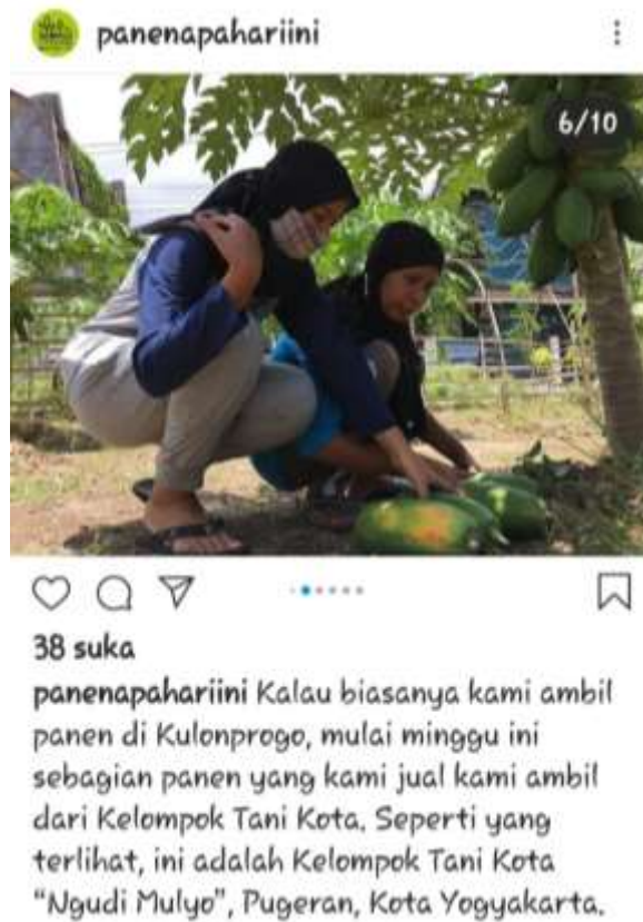
Gambar 19. Pemasaran Produk Kelompok Melalui Medsos