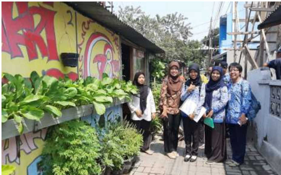
Gambar 15. Lomba Kampung Sayur