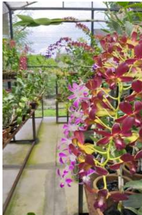
Gambar 23. Green House Percontohan Anggrek