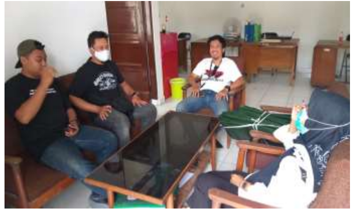
Gambar 4. Memberikan Konsultasi Untuk Kelompok Tani di BPP Nitikan