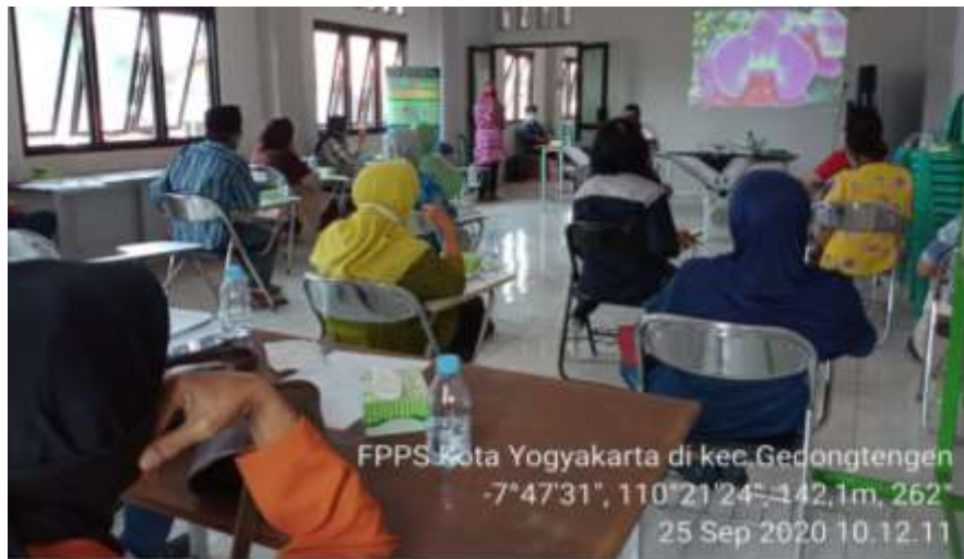
Gambar 12. Sosialisasi FPPS