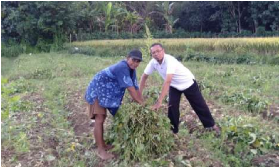
Gambar 11. Pembinaan Petani Lahan Sawah