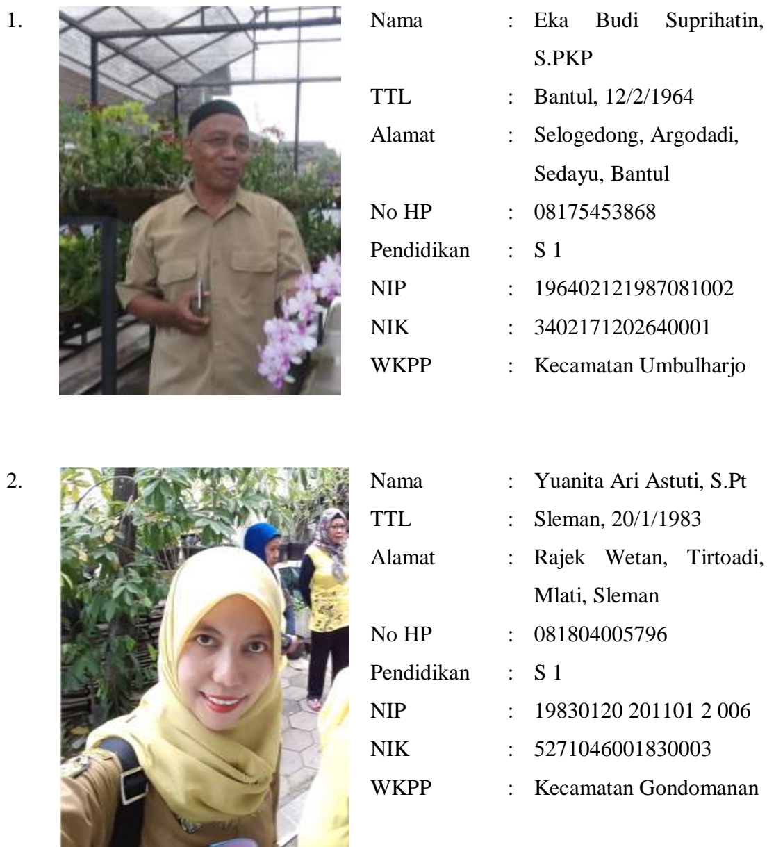
Tabel 7. Data Penyuluh Pertanian Kota Yogyakarta

Penyuluh Pertanian berjumlah 13 orang, terdiri atas 5 PNS, 7 THL-TBPP dan 2 Tenaga Teknis. Data Penyuluh Pertanian Kota Yogyakarta ditampilkan dalam tabel berikut.