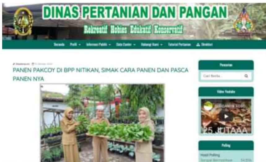
Gambar 13. Penyebaran Informasi Komoditas Hortikultura