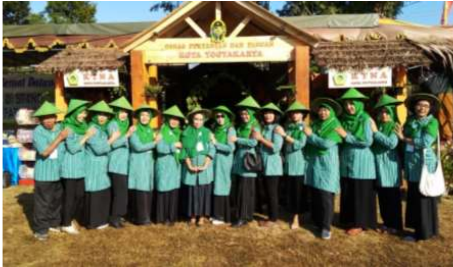
Gambar 18. Pekan Daerah Tahun 2019