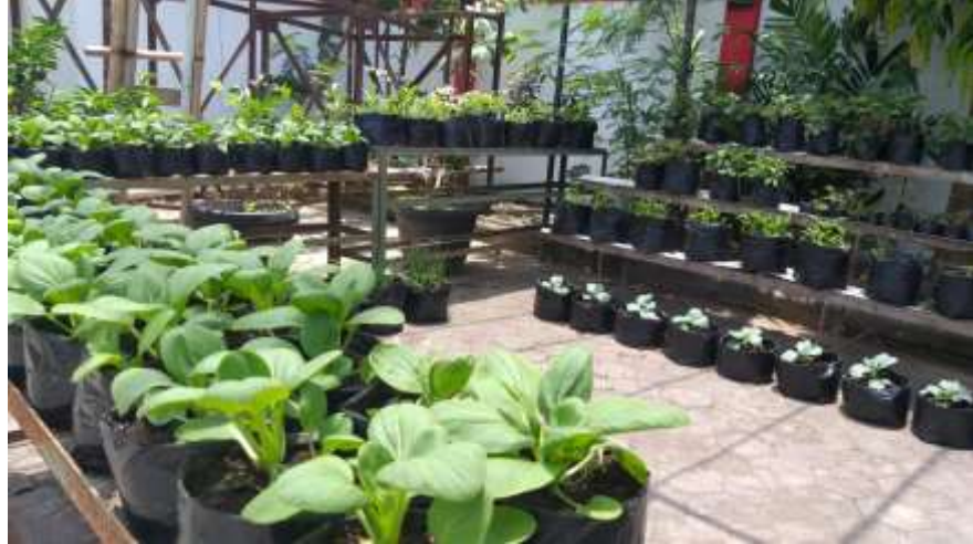
Gambar 24. Kaji Terap Sayuran Semusim