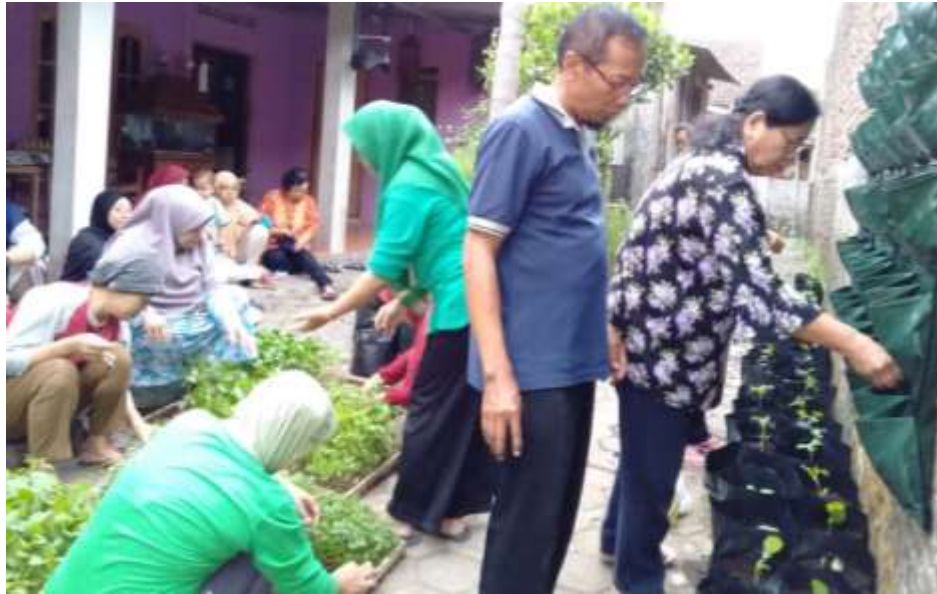
Gambar 6. Pertemuan dan kerja bakti kelompok