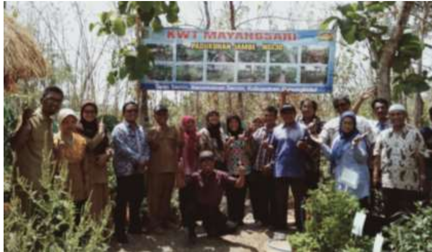
Gambar 22. Kunjungan Kerja Penyuluh Pertanian Kota Yogyakarta Ke BPP Semin, Gunung Kidul