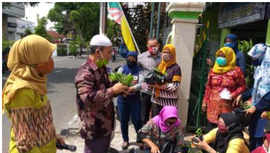
Gambar 7. Mengajar Kursus Tani / Bimbingan Teknis