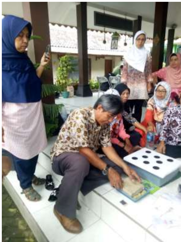
Gambar 8. Mengajar Praktek Pembuatan Hidroponik