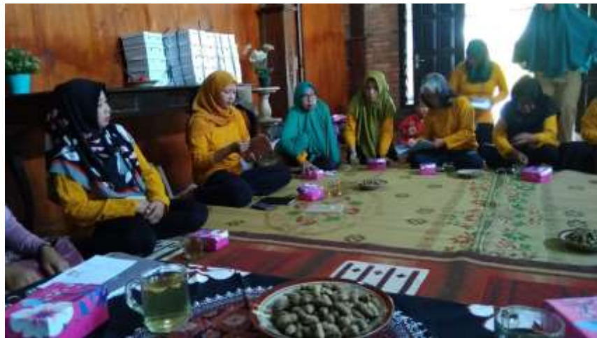
Gambar 2. Anjagsana/Pertemuan Kelompok Tani

Pembinaan kelompok dalam rangka peningkatan Pengetahuan, Ketrampilan dan Sikap (PKS) petani dilaksanakan dengan berbagai metode penyuluhan seperti anjagsana perorangan/kelompok/massa dan berbagai metode penyuluhan lainnya.