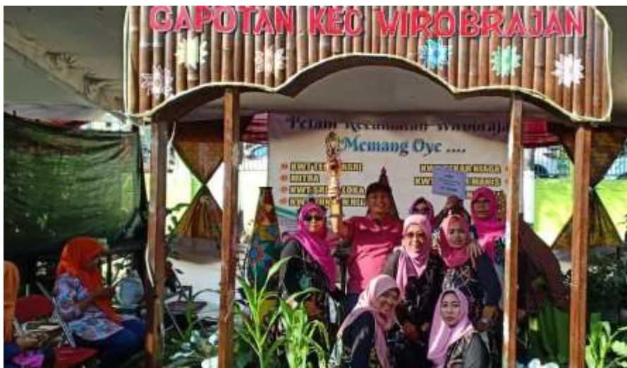
Gambar 17. Gelar Potensi Pertanian Tahun 2019