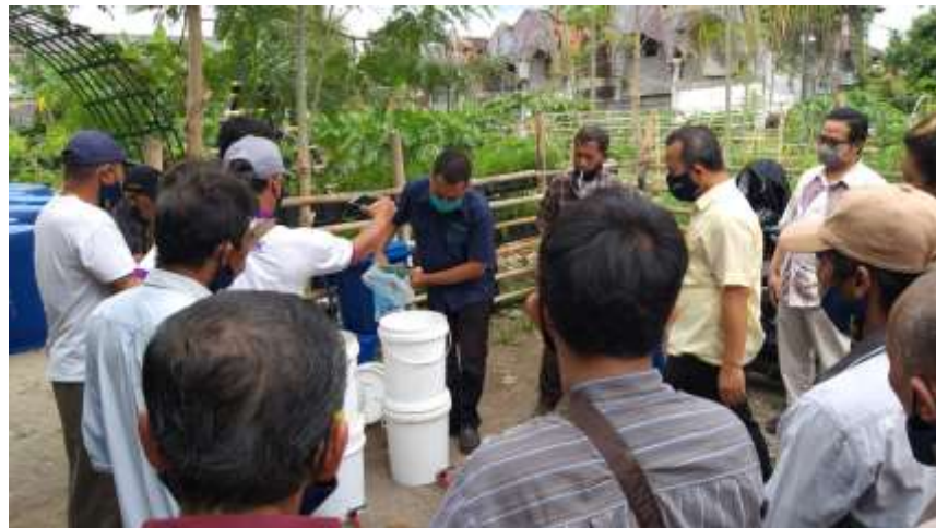
Gambar 21. Kersajama Penyediaan Sarpras dan Pelatihan Dengan PIAT UGM